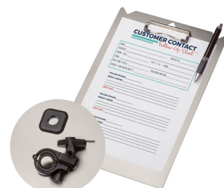
KLEMMBRETT FÜR TRANSPORTWAGEN, ALUMINIUM, DIN A4