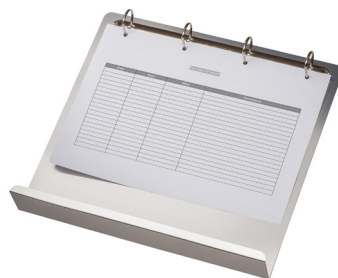
MAGNETISCHES RINGBUCHBRETT MIT EINER 4-RINGMECHANIK MIT ABLAGE, ALUMINIUM, DIN A4