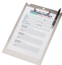
KLEMMBRETT, ALUMINIUM, DIN A4