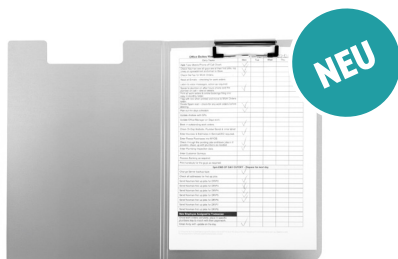
KLEMMBRETT MIT KLAPPE, ALUMINIUM, DIN A4

Extrem dünn und leicht, hochwertig, modern und elegant. Hergestellt aus 80 % recyceltem Aluminium. Für komfortables Notieren unterwegs.